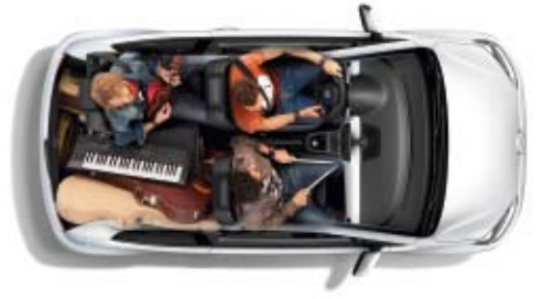
Für noch mehr Stauraum ist die Rückbank je nach Ausstattungslinie geteilt oder komplett umklappbar.