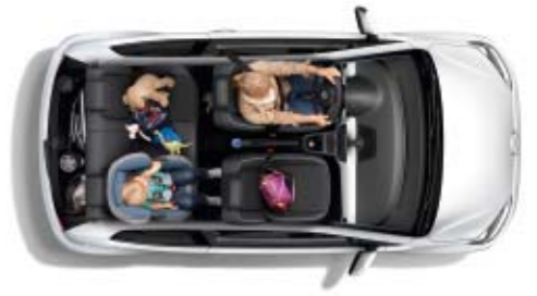
Der Kofferraum fasst bei aufgestellter Rückbank 251 Liter – ein Klassenbestwert.