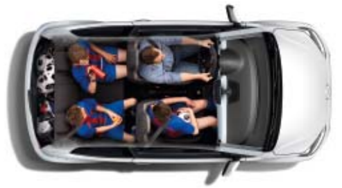
Der neue up! ist ein vollwertiger Viersitzer mit ausreichend Komfort und Raum.

Informationen zu Kraftstoffverbräuchen, CO 2 -Emissionen und Effizienzklassen finden Sie auf Seite 30.