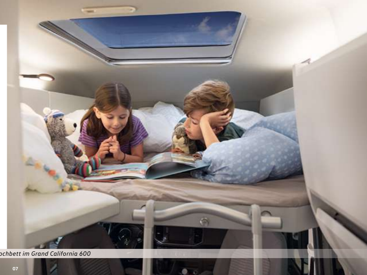
» Das optionale Hochbett im Grand California 600

07 Optionales Hochbett (1,60 m - 1,90 m x 1,22 m) mit Panoramadach (0,70 m x 0,85 m), Aluminiumleiter und zwei Leseleuchten im Grand California 600. Es bietet 150 kg Traglast und Platz für zwei Kinder oder einen Erwachsenen. Der Lattenrost ist auf Knopfdruck herausziehbar und das Panoramadach hat eine Verdunkelung sowie ein Moskitonetz.