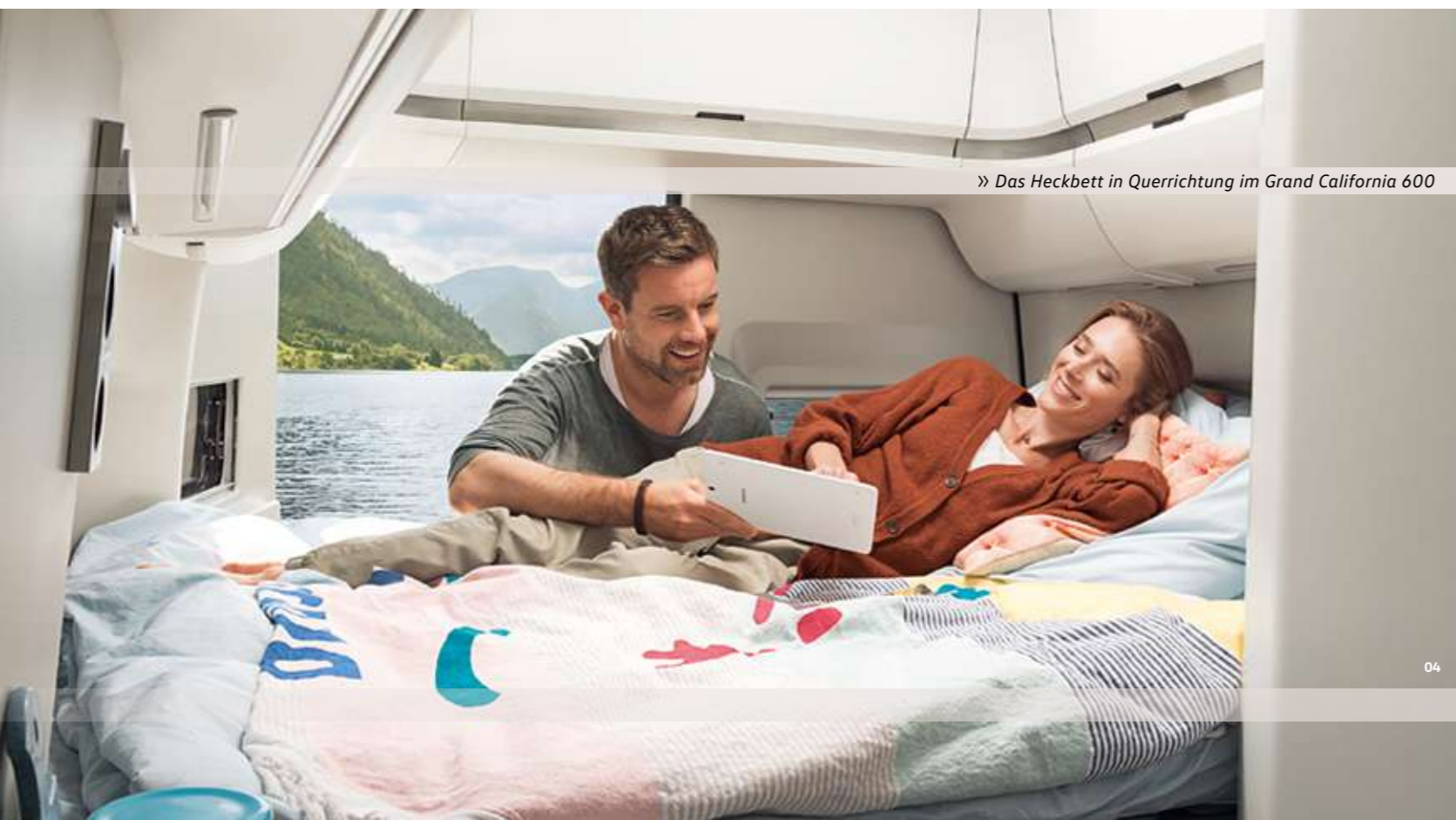
» Das Heckbett in Querrichtung im Grand California 600