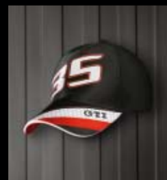
Cap „GTI 35“

→ Ein klares Bekenntnis zum Golf GTI Edition 35: Mit der Herren-Sweatjacke zeigt der passionierte GTI-Fan, welches Auto sein Herz höher schlagen lässt. Passend dazu: der Gürtel aus original „Jacky“-Stoff.