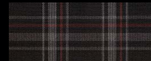
Stoffsitzbezug „Jacky“ (XE) |S

Zwei Dinge haben beide Sitzbezüge gemeinsam: hochwertige Materialien und kompromisslos gute Verarbeitung. Dadurch sind die Sitze perfekt vor Abnutzung geschützt.