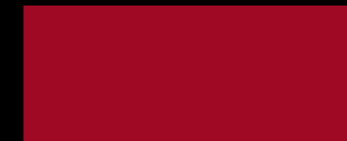
Tornadorot (G2) |S

Das aufwendige Lackierungsverfahren von Volkswagen wird allerhöchsten Ansprüchen gerecht und bietet Ihrem Fahrzeug zuverlässigen Korrosionsschutz über dessen gesamte Lebensdauer.