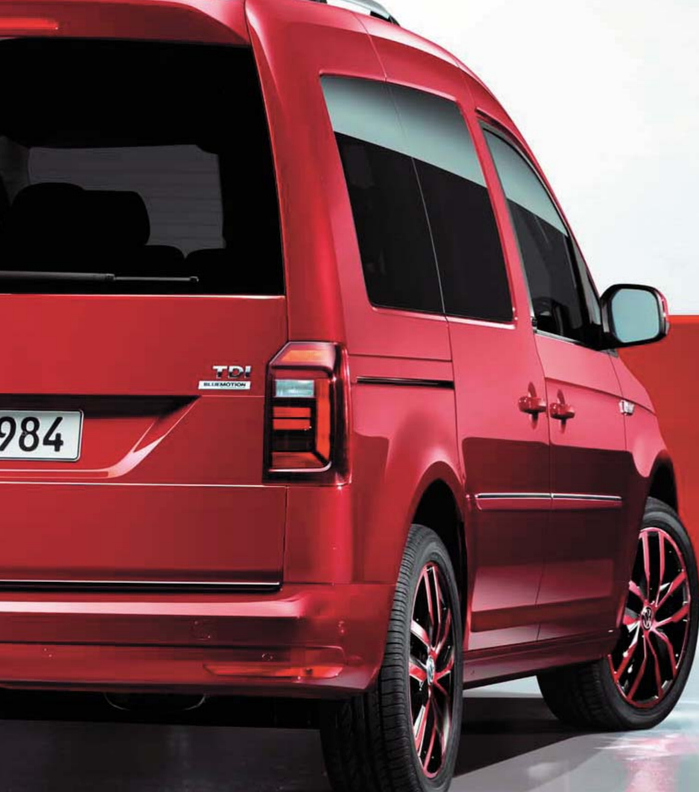
Abbildung zeigt Sonderausstattung gegen Mehrpreis.