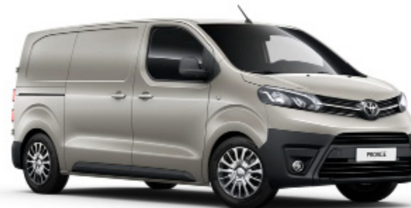
NEU sandstein metallic