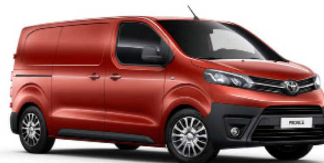
KHK karneolorange metallic