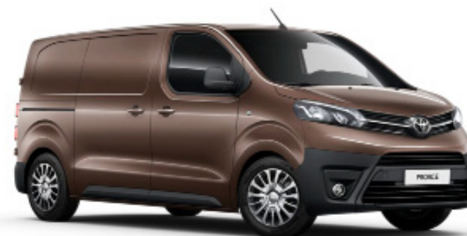
KCM barriquebraun metallic