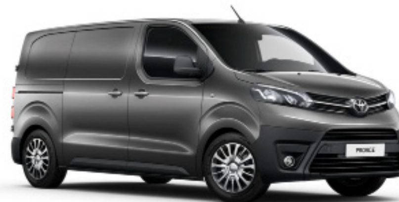
EVL basaltgrau metallic