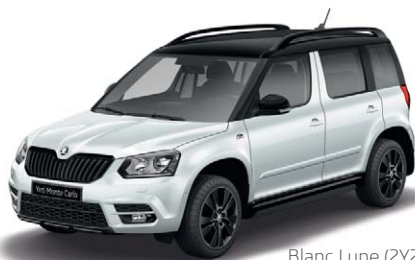
Blanc Lune (2Y2Y)