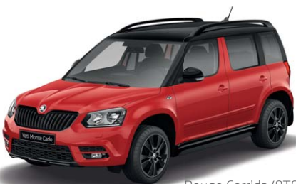
Rouge Corrida (8T8T)