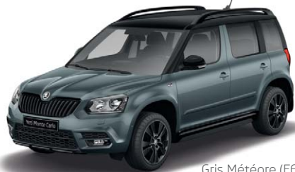
Gris Météore (F6F6)