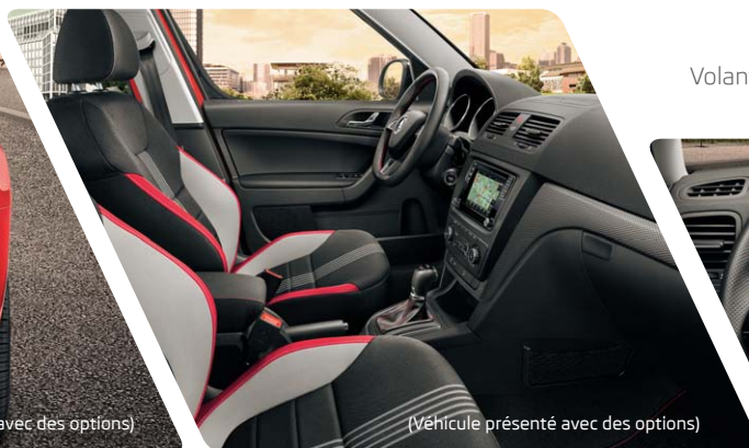
Volant multifonctions Sport 3 branches à méplat