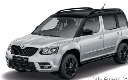
Gris Argent (8E8E)