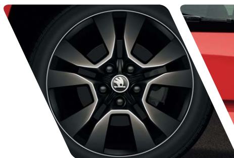
Jantes alliage 17" "Origami Noir"