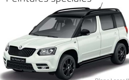
Blanc Laser (J3J3)