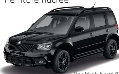
Noir Magic Nacré (I2I2)