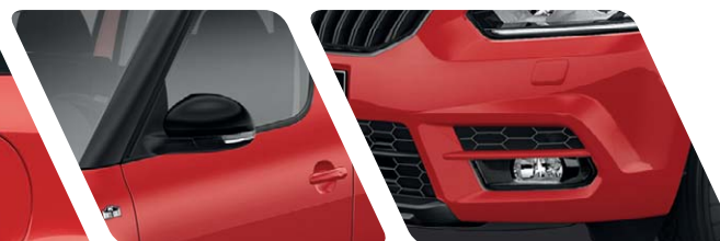
Phares avant antibrouillard