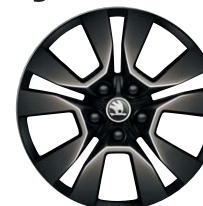
Jantes alliage 17" Origami Noir