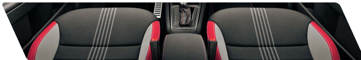
Tissu Monte-Carlo DR