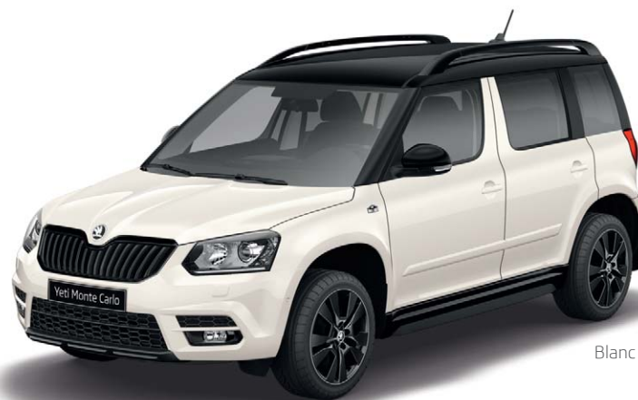
Blanc Cristal (9P9P)