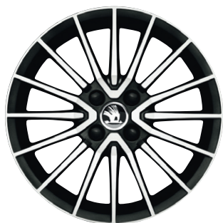
Jantes alliage 16" Serpens Anthracite (option)