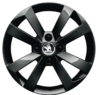
Jantes alliage 15" Auriga Noires (série)

Racée et dynamique, cette nouvelle Citigo Monte-Carlo affirme son allure sportive en se dotant d'appendices musclés qui lui confèrent un look résolument tendance. Equipée de la climatisation à régulation mécanique, d'une radio avec écran couleur, de jantes alliage 15" ou encore de l'intérieur sport, cette nouvelle Monte-Carlo saura vous apporter tout le style et l'énergie dont vous avez besoin pour faire de chaque escapade une expérience unique.