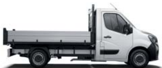
Benne basculante arrière

Nouveau Renault MASTER se décline en de nombreuses versions dont la benne basculante arrière. Les châssis ou planchers sont idéaux pour les transformations les plus variées.