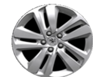
Jantes alliage 17" peintes Gris Eclat Cliquer