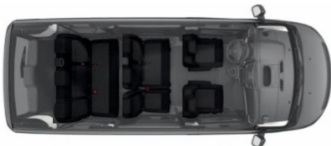
Configuration de série > 8 places