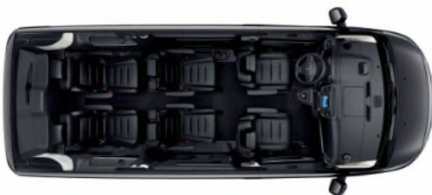
Configuration de série > 6 places