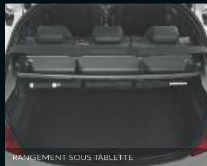
RANGEMENT SOUS TABLETTE