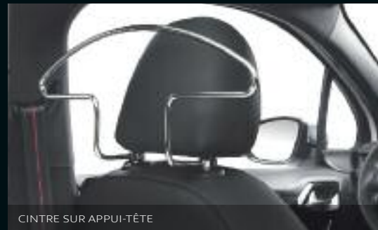
CINTRE SUR APPUI-TÊTE

Démultipliez les effets de l'expérience GTI en dotant votre 208 d'accessoires adaptés en fonction de vos envies et de vos besoins pour encore plus de confort et de praticité.