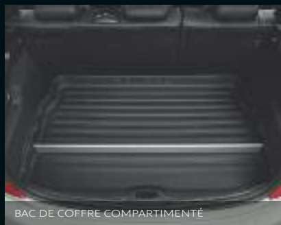
BAC DE COFFRE COMPARTIMENTÉ