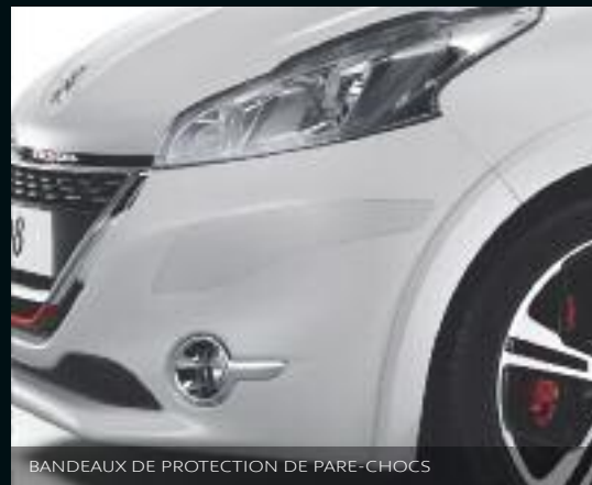
BANDEAUX DE PROTECTION DE PARE-CHOCS