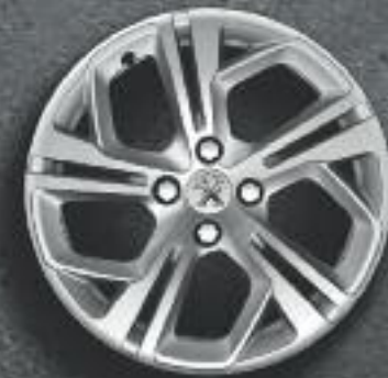
Jante 17" Carbone diamantée Etincelle* (verniss mat)

Découvrez les modèles de jantes spécifiques en option et de nombreux stickers de personnalisation. Agrémentez le capot ou le toit –qu’il soit en verre ou en tôle- d’un damier sportif et affichez vos couleurs sur le jonc de calandre. Véhicule présenté avec options.