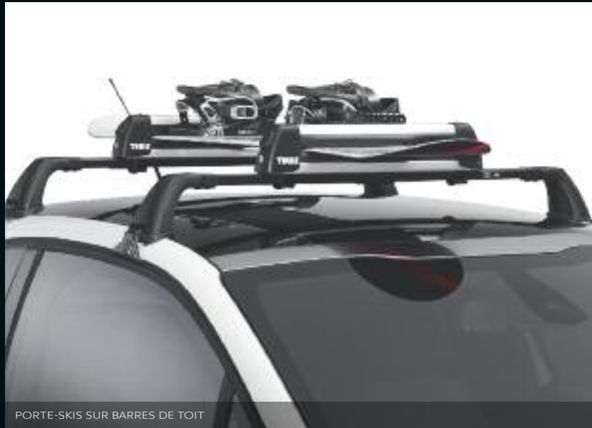
PORTE-SKIS SUR BARRES DE TOIT