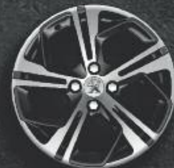
Jante 17" Carbone diamantée Noir Onyx* (verniss brillant)