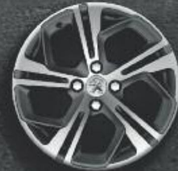
Jante 17" Carbone diamantée Storm (verniss mat)