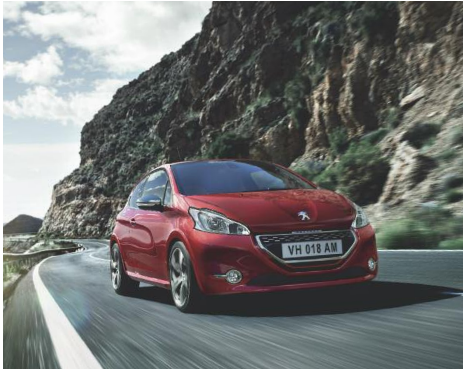
PEUGEOT 208 GTi