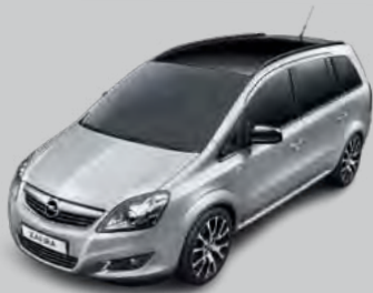
Color-Paket mit Außenfarbe Argonsilber