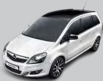
Color-Paket mit Außenfarbe Schneeweiß