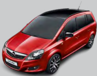
Color-Paket mit Außenfarbe Powerrot