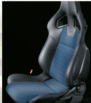
Splice, Blau/Morrocana 1 , Anthrazit