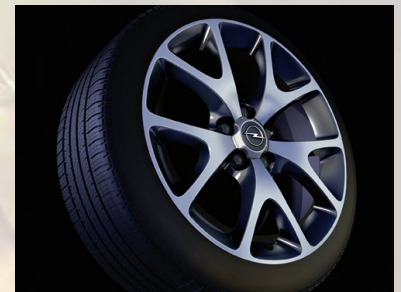
BiColor-Leichtmetallrad 7½ J x 18 im 5-Speichen-OPC-Design, Reifen 225/35 R 18