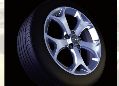
Leichtmetallrad 7 J x 17 im 5-Speichen- OPC-Design, Reifen 215/45 R 17