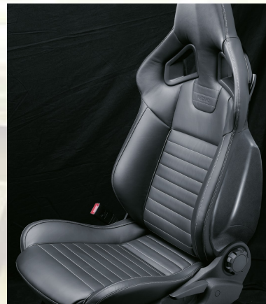
Leder 2 , Anthrazit

Kombinieren Sie sportliche Außenfarben und hochwertige Rennsitz-Optik: Wählen Sie Ihre individuelle Kombination.