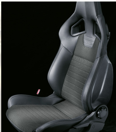
Splice, Silber/Morrocana 1 , Anthrazit