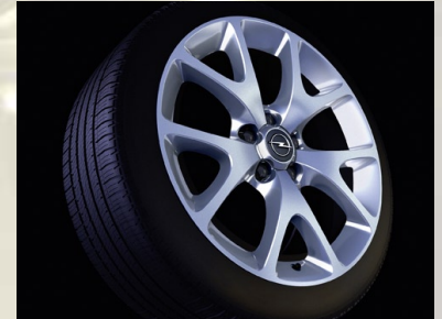
Leichtmetallrad 7½ J x 18 im 5-Speichen- OPC-Design, Reifen 225/35 R 18