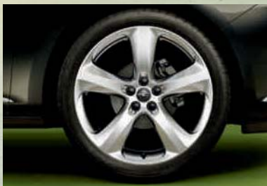
Leichtmetallrad 8 J x 19 im 5-Speichen-Design, Reifen 235/40 R 19 (PZS). Optional für Edition, Sport und INNOVATION.