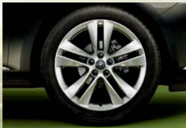
Leichtmetallrad 7½ J x 18 bzw. 8 J x 18 im 5-Doppelspeichen-Design, Reifen 225/45 R 18 bzw. 235/45 R 18 (PZV/PZJ). Optional für Edition, Sport und INNOVATION.