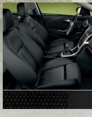
Ergonomiesitz: Lace, Schwarz/ Atlantis, Schwarz Dekorleiste: modellspezifisch