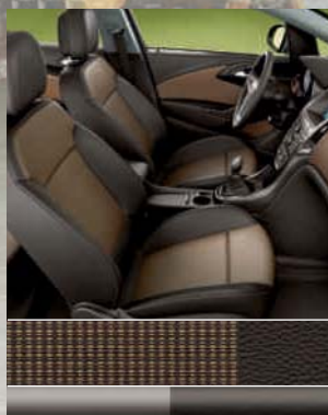
INNOVATION: Ribbon, Beige/ Morrocana, Cocoa 1 Dekorleiste: Matrix Cocoa/ Palladium