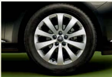
Leichtmetallrad 7 J x 17 im 10-Speichen-Design, Reifen 215 (225)/50 R 17 (PGQ). Serie bei INNOVATION, optional für Edition.