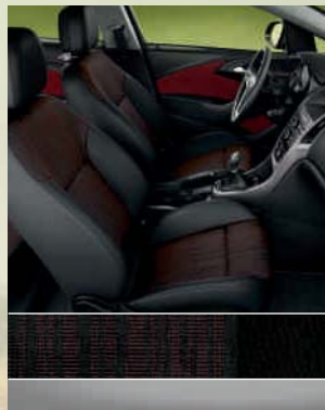
Edition: Scene, Rot/Atlantis, Schwarz Dekorleiste: Titangrau