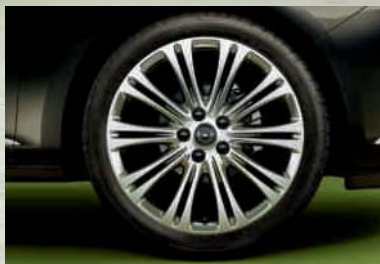
Leichtmetallrad 8 J x 19 im 10-Doppelspeichen-Design, Reifen 235/40 R 19 (Q1A). Optional für Edition, Sport und INNOVATION.