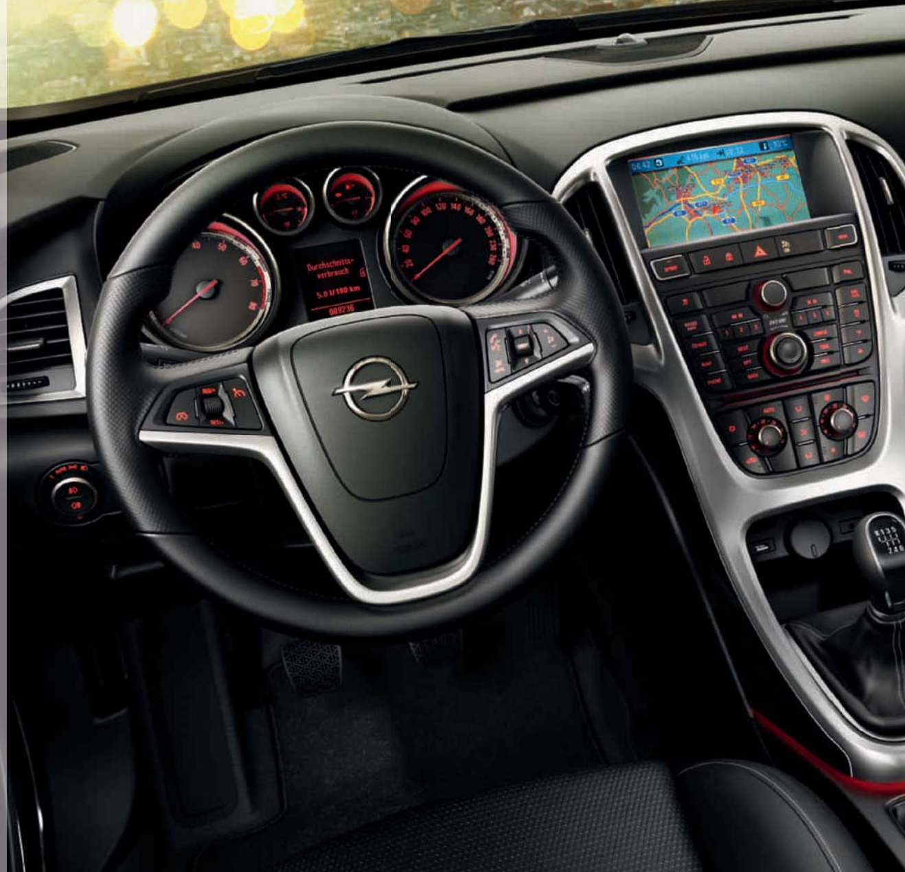
Abbildung zeigt Sonderausstattung.