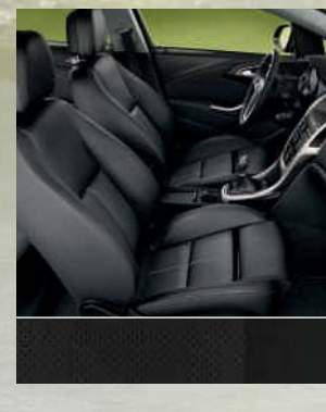
Ergonomiesitz: Leder, Schwarz Dekorleiste: modellspezifisch