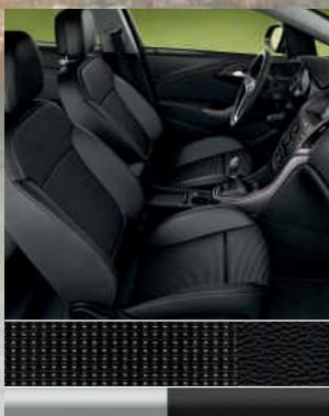
INNOVATION: Ribbon, Schwarz/ Morrocana, Schwarz Dekorleiste: Matrix/Platin