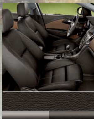
INNOVATION: Ergonomiesitz: Leder, Cocoa 1 Dekorleiste: Matrix Cocoa/ Palladium