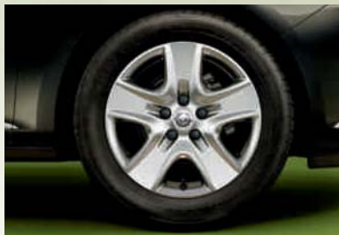
Designrad 7 J x 17 im 5-Speichen-Design, Reifen 215 (225)/50 R 17 (PWT). Serie bei Edition.