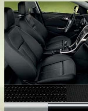
Sport: Lace, Schwarz/Atlantis, Schwarz Dekorleiste: Klavierlack/Platin