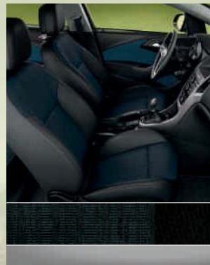
Edition: Scene, Blau/Atlantis, Schwarz Dekorleiste: Titangrau