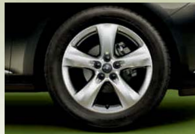
Leichtmetallrad 7 J x 17 im 5-Speichen-Design, Reifen 215 (225)/50 R 17 (PWX). Serie bei Sport, optional für Edition.