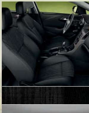
Edition: Scene, Schwarz/ Atlantis, Schwarz Dekorleiste: Titangrau