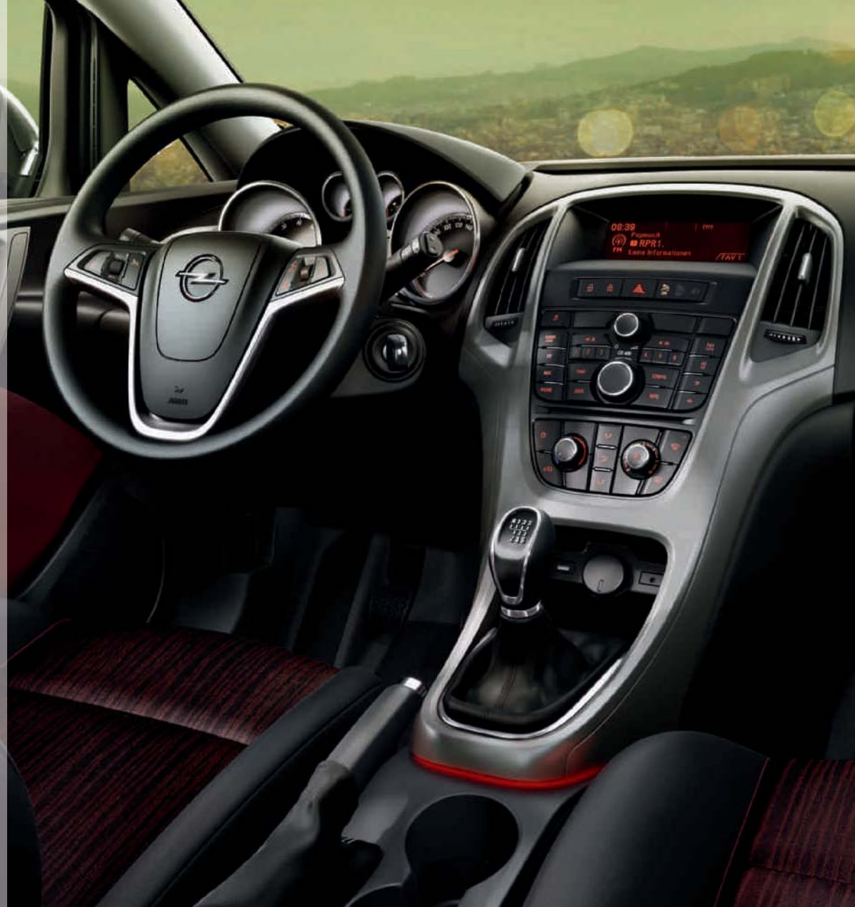
Abbildung zeigt Sonderausstattung.