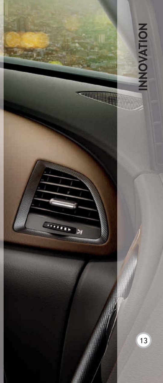
Abbildung zeigt Sonderausstattung.