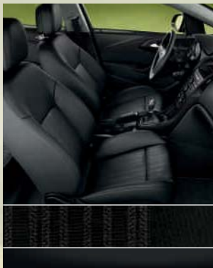
Selection: Cordoba, Schwarz/ Atlantis, Schwarz Dekorleiste: Perlschwarz