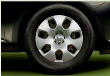
Stahlrad 6½ J x 16 bzw. 7 J x 17 inkl. Abdeckung, Reifen 205 (215)/60 R 16 bzw. 215 (225)/50 R 17 (PWM/PWP). Serie bei bzw. optional für Selection.