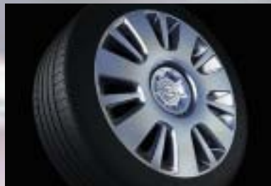
2 Stahlrad, 6 1/2 J x 16, ganzflächige Radabdeckung, Reifen 205/55 R 16