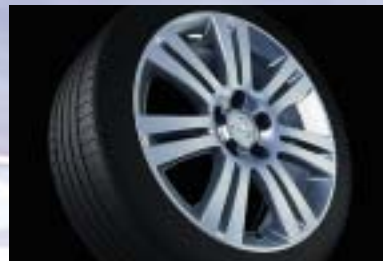
6 Leichtmetallrad, 6½ J x 16, 7-Doppelspeichen-Design, Reifen 205/55 R 16