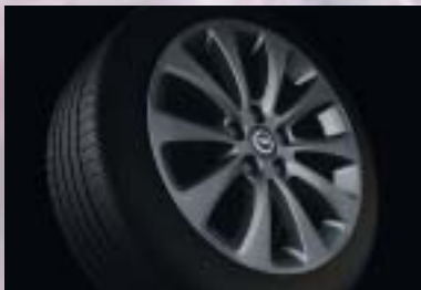
7 Leichtmetallrad, 6 1/2 J x 16 bzw. 7 J x 17, 10-Strahlenspeichen-Design, titanfarben, Reifen 205/55 R 16 bzw. 225/45 R 17