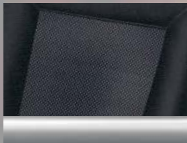
Twist/Elba, Anthrazit Dekorleiste: Mattchrom