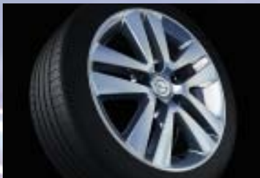
5 Leichtmetallrad, 6½ J x 16, 5-Doppelspeichen-Design, Reifen 205/55 R 16