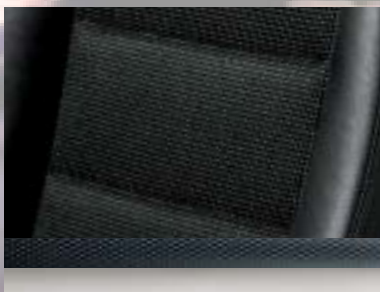
Alpha, Silber/Morrocana, Anthrazit Dekorleiste: Mattchrom Seidenglanz