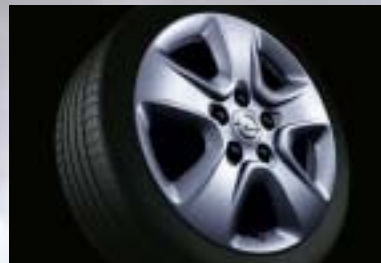
3 Designrad 6 1/2 J x 16, 5-Speichen-Design, Reifen 205/55 R 16