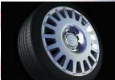
1 Stahlrad, 6 1/2 J x 15, ganzflächige Radabdeckung, Reifen 195/65 R 15