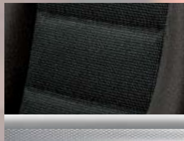
Alpha, Silber/Elba, Anthrazit Dekorleiste: Mattchrom (bei Edition „111 Jahre“) oder Chromquader (bei GTC Sport)