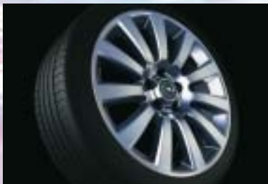
11 Leichtmetallrad, 7½ J x 18, 11-Speichen-Design, Reifen 225/40 R 18