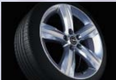
13 Leichtmetallrad, 7½ J x 18, 5-Speichen-Design, Reifen 225/40 R 18