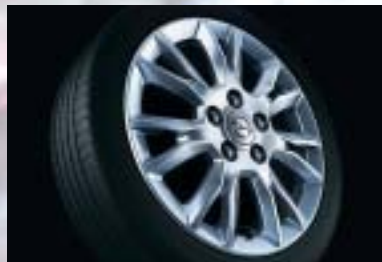
8 Leichtmetallrad, 6 1/2 J x 16, 7-Trapez-Speichen-Design, Reifen 205/55 R 16