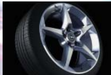
12 Leichtmetallrad, 7½ J x 18, 5-Speichen-Stern-Design, Reifen 225/40 R 18