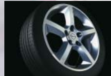
10 Leichtmetallrad, 7 J x 17, 5-Speichen-Design, Reifen 225/45 R 17