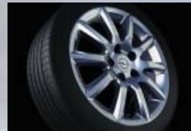
4 Leichtmetallrad, 6 1/2 J x 16, 10-Speichen-Design, Reifen 205/55 R 16