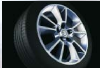
9 Leichtmetallrad, 7 J x 17, 5-Doppelspeichen-Design, Reifen 225/45 R 17