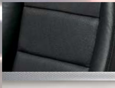
Leder, Anthrazit Dekorleiste: Mattchrom Seidenglanz (bei INNOVATION) oder Chromquader (bei GTC Sport)