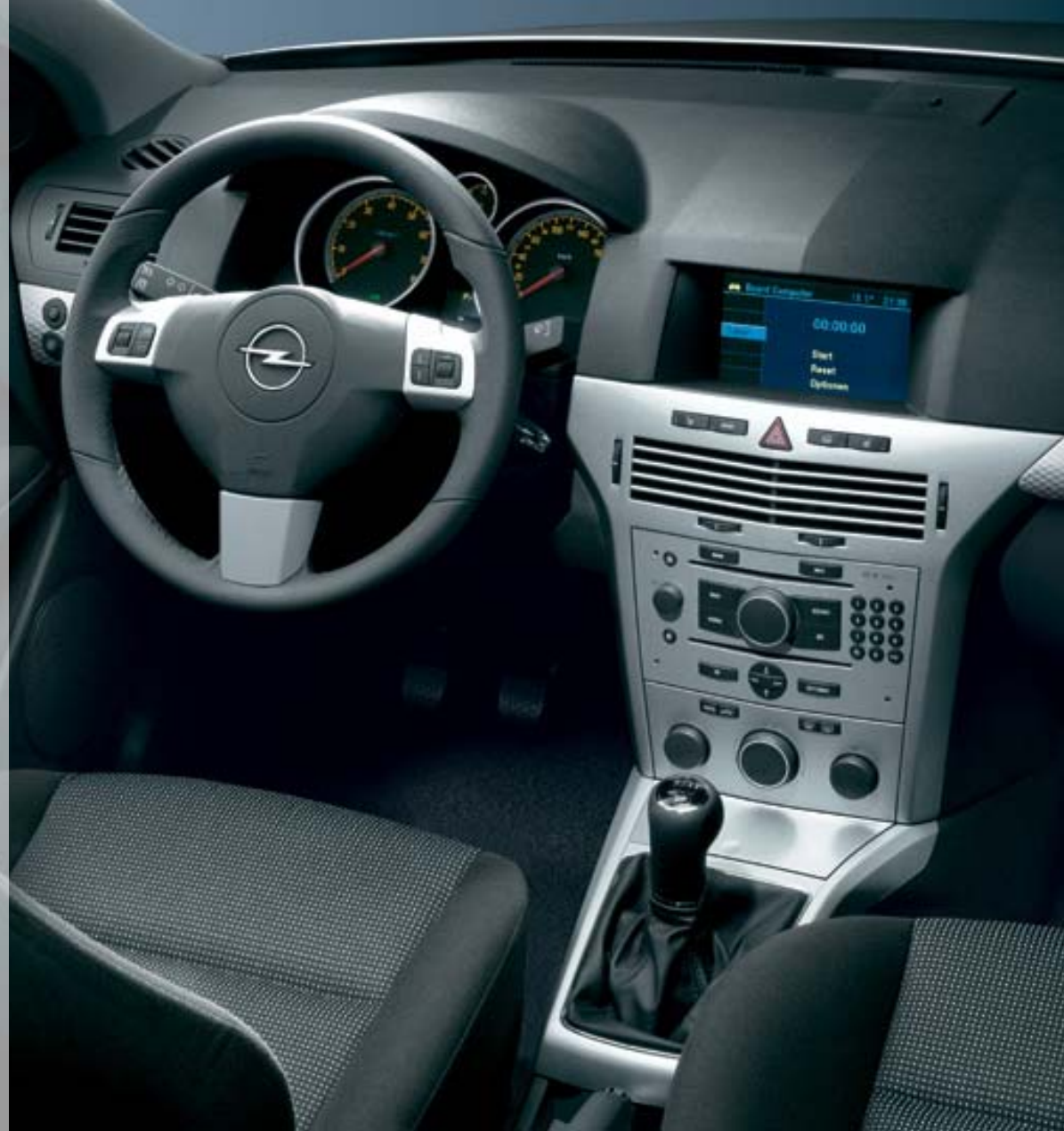
Abbildung zeigt Sonderausstattung.