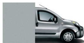
612 Grigio Chiaro