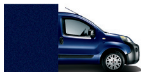
487 Blu Scuro