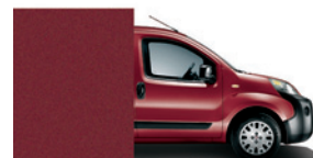
293 Rosso Scuro