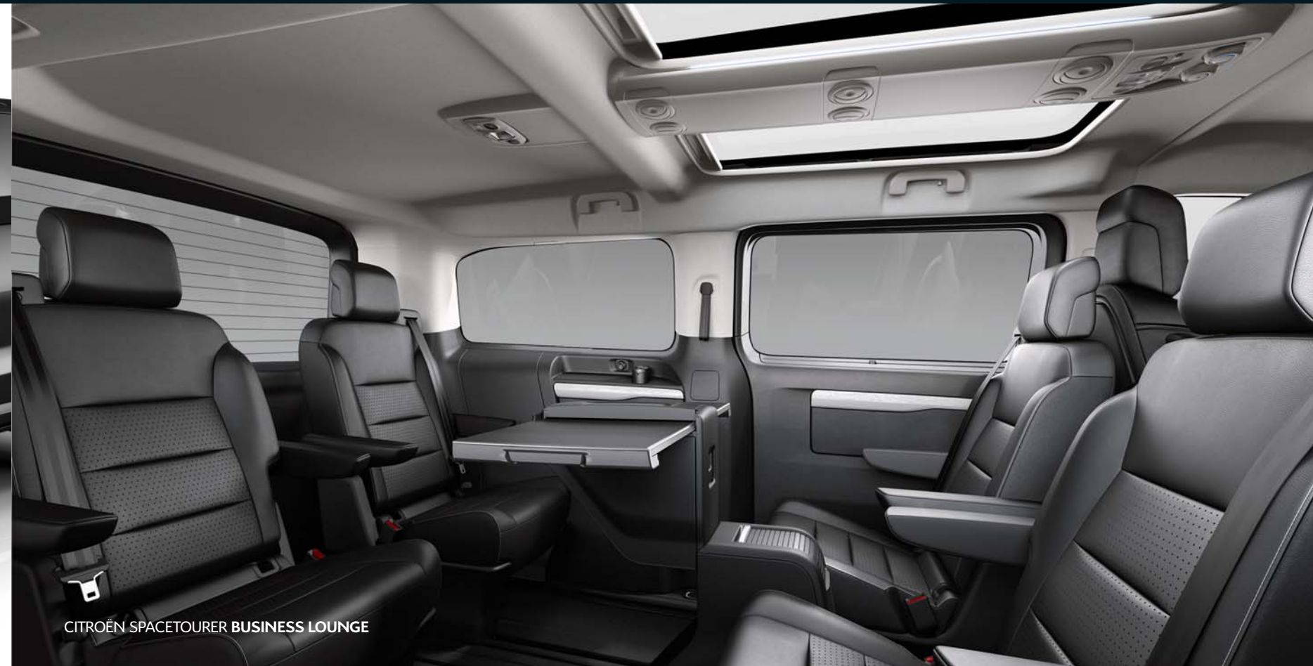
CITROËN SPACETOURER BUSINESS LOUNGE