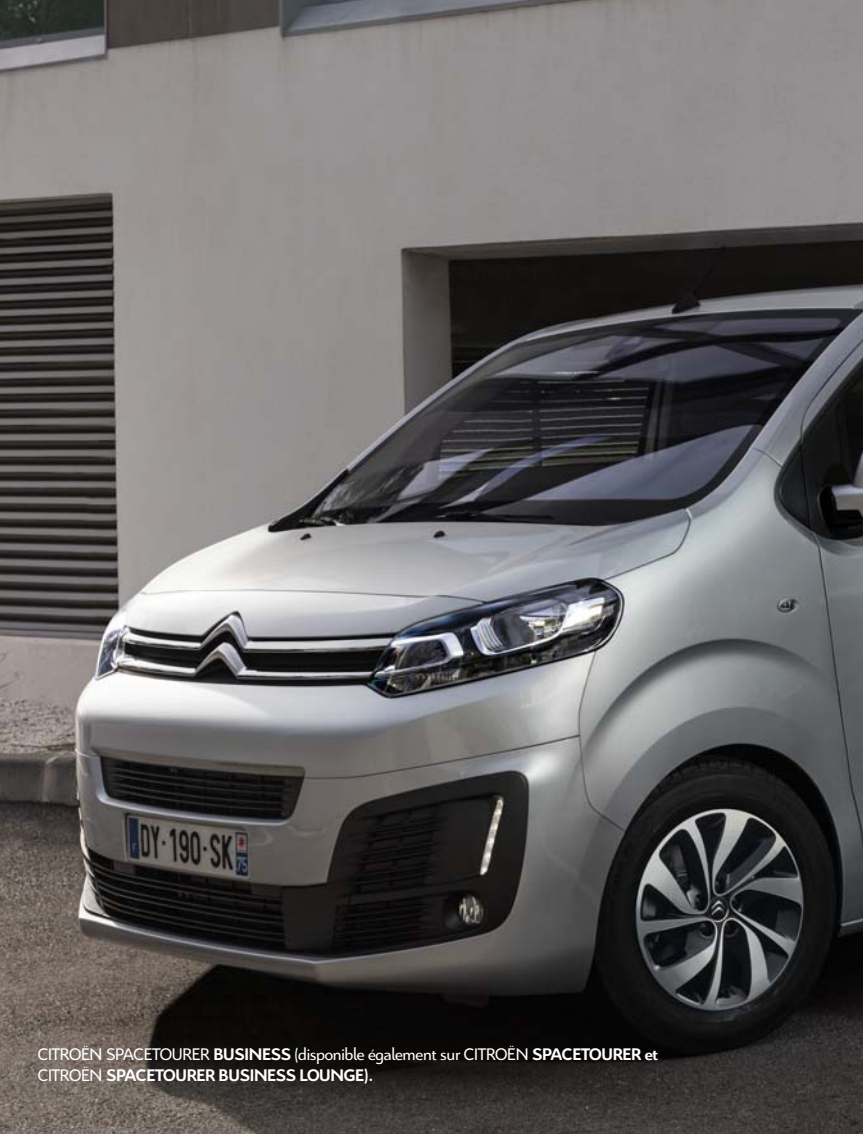
CITROËN SPACETOURER BUSINESS (disponible également sur CITROËN SPACETOURER et CITROËN SPACETOURER BUSINESS LOUNGE).