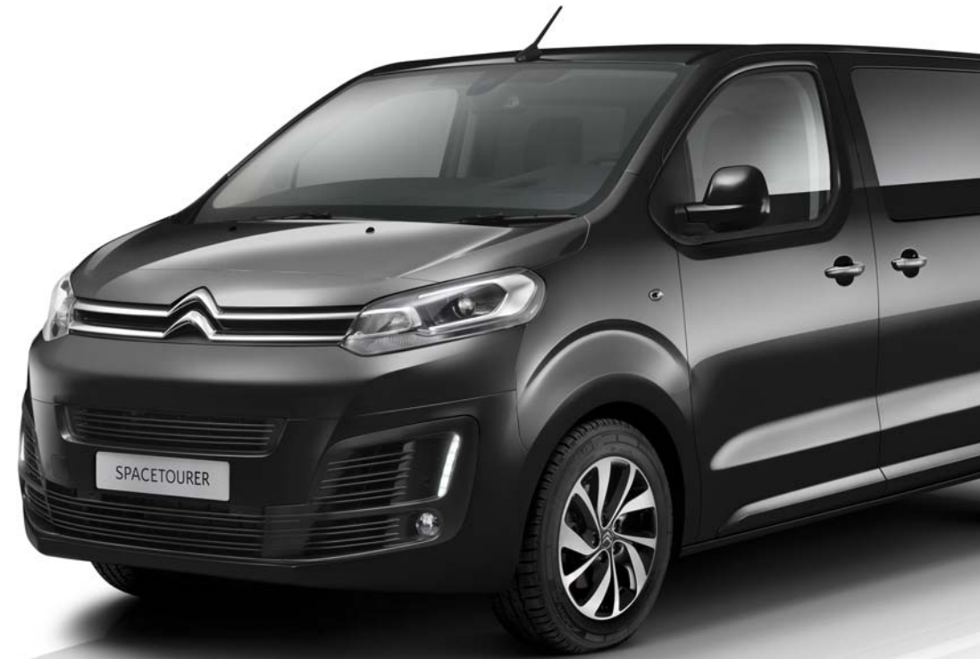
CITROËN SPACETOURER BUSINESS LOUNGE

Les qualités de CITROËN SPACETOURER BUSINESS LOUNGE s'adressent tout autant à son conducteur qu'à ses passagers, grâce à son style élégant, son confort raffiné et ses prestations haut de gamme. Le salon mobile avec ses 4 ou 5 places en vis-à-vis et le toit vitré permettent de créer des conditions de voyage idéales.