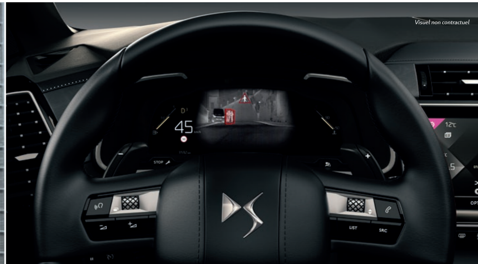
Visuel non contractuel