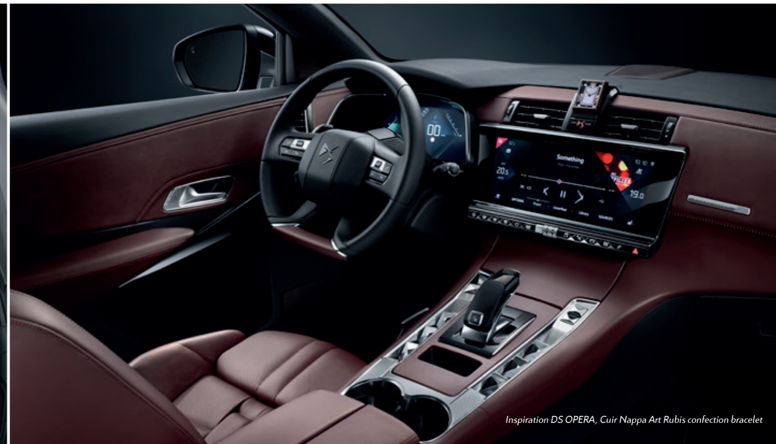
Inspiration DS OPERA, Cuir Nappa Art Rubis confection bracelet