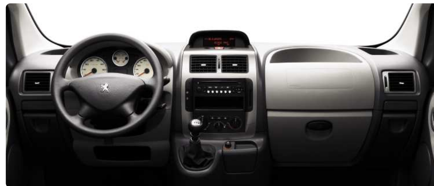
Planche de bord. Le tableau de bord possède une ergonomie étudiée pour un maximum de confort de conduite, avec notamment un levier de vitesse sur la planche de bord et trois cadrans dans le combiné.

Le pavillon d'Expert Tepee dispose de six diffuseurs d'air; sur les versions équipées du groupe climatisation/ chauffage additionnel arrière, assurant un confort thermique exceptionnel et de liseuses pour chaque passager.