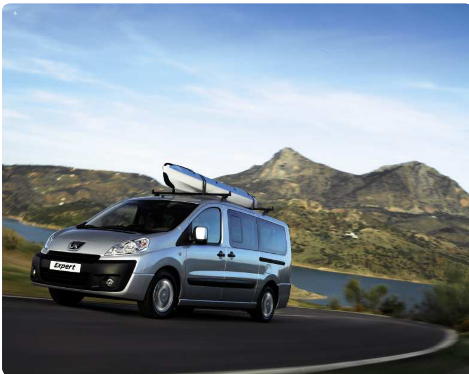
Barres de toit post-équipement