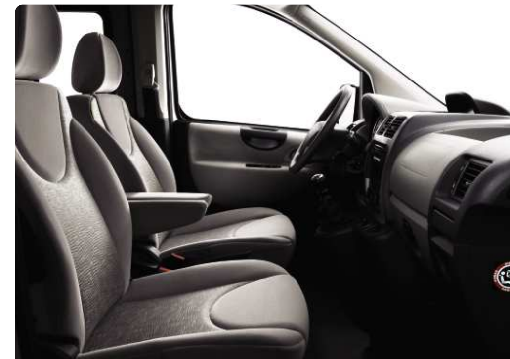
Chaîne et trame : Mikado et velours Misteko grège