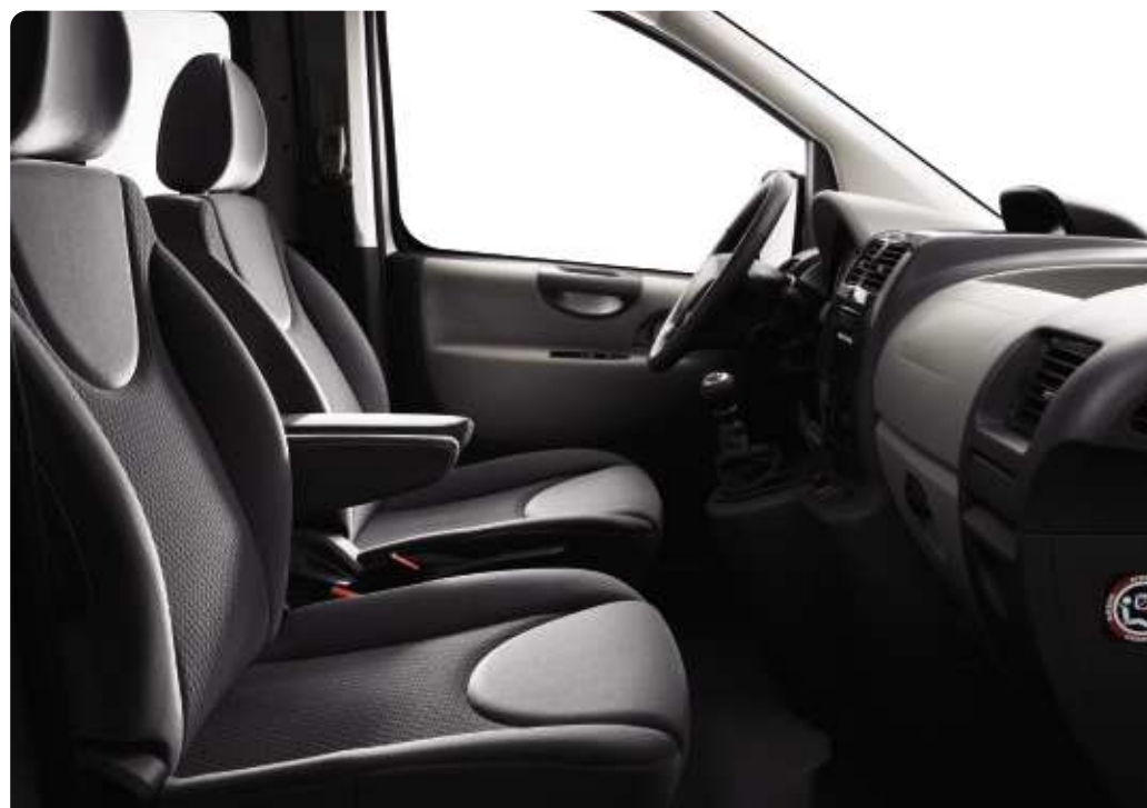
Gris Narbonnais/Gris Sirocco en velours Jocaste