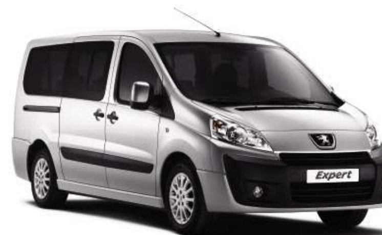
Jantes aluminium en option