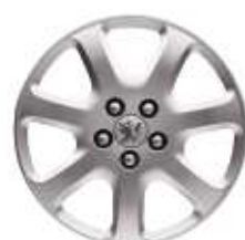
Enjoliveur "Novae" 16"