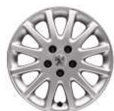
Jante alu "Vivace" 16"