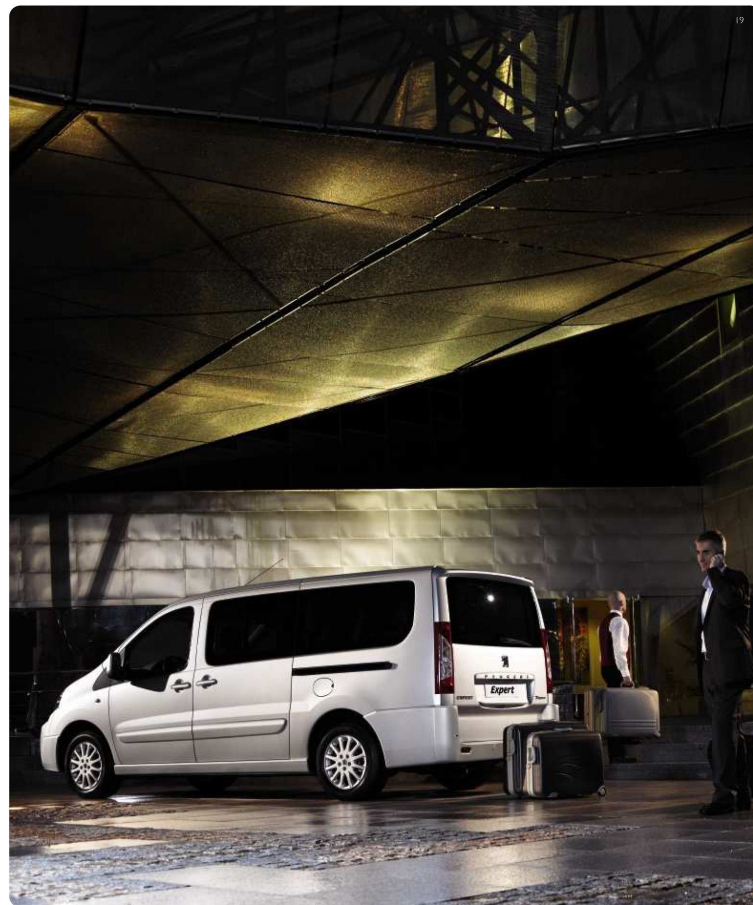
Jantes aluminium et peinture intégrale en option