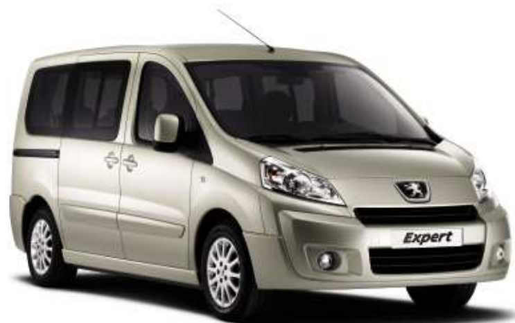
Jantes aluminium et peinture intégrale en option

*Allumage automatique des feux et essui-vitres automatique **En option