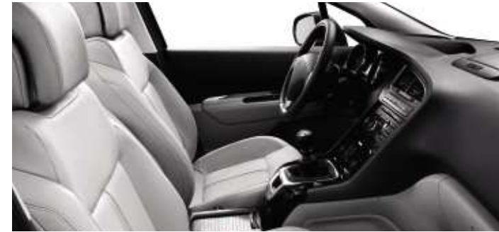
Cuir Guérande* (en option)