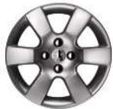
Jante 16" ERIS