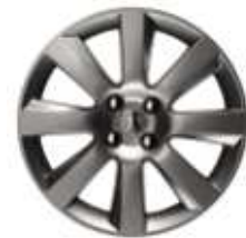
Jante 18" MAGNETIK