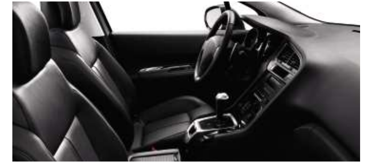
Cuir Noir Tramontane* (en option)