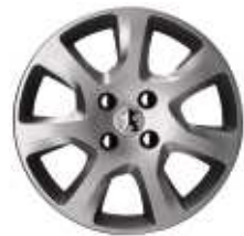
Enjoliveur 16" HAUMEA