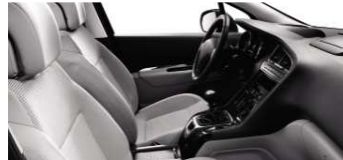
Tissu Strada Guérande