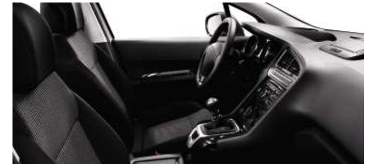
Tissu Strada Noir Tramontane