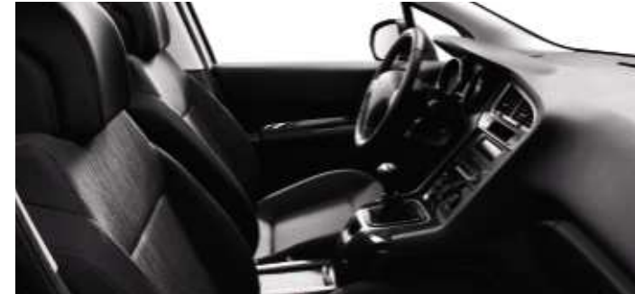
Tissu Ligne Noir Tramontane