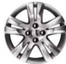
Jante 17" QUARK