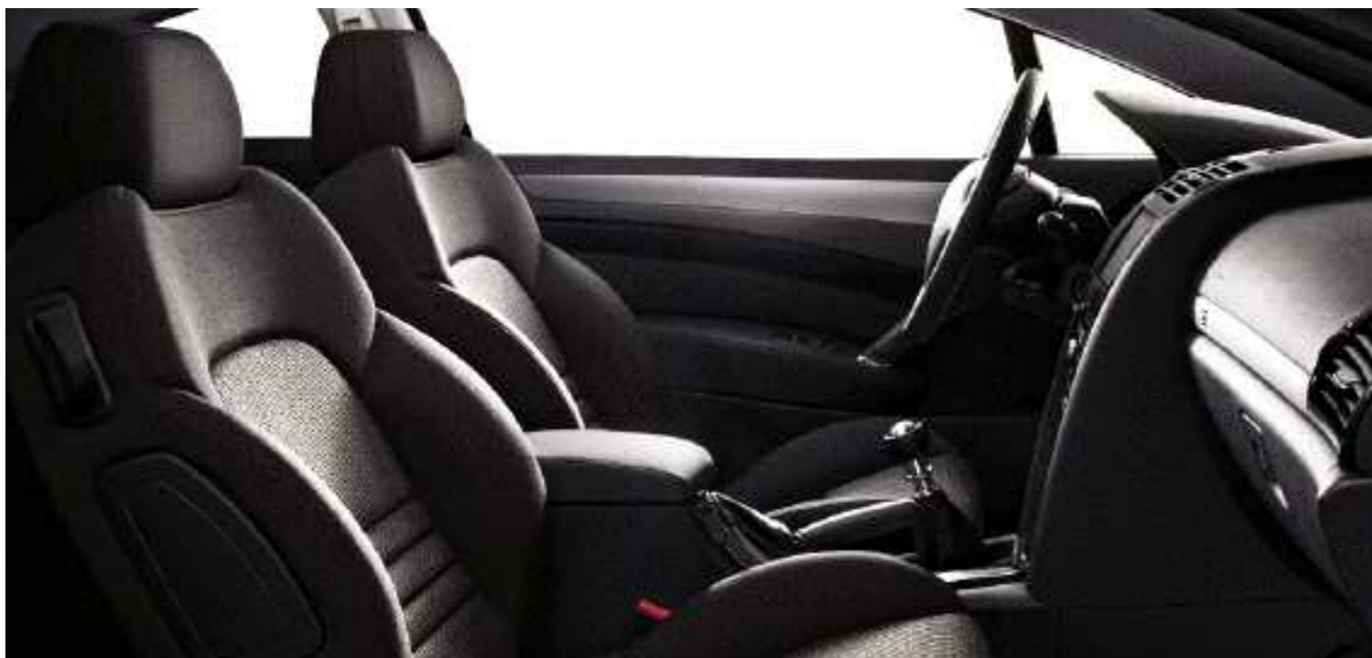
Tessuto Speed'Up Nero

e in opzione : Pelle* Lama Pelle* Mistral