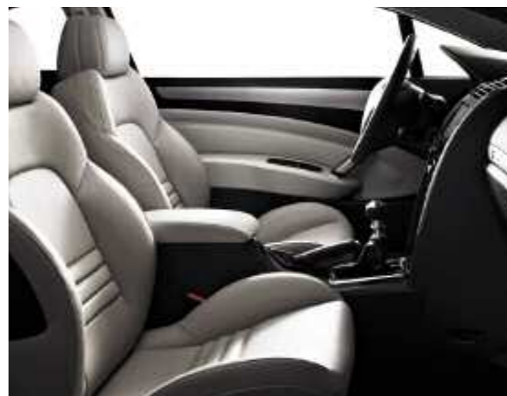
Pelle* Lama (modello presentato con opzione Pelle Integrale**)

Rivestimenti disponibili di serie: Pelle Integrale** Lama Pelle Integrale** Mistral