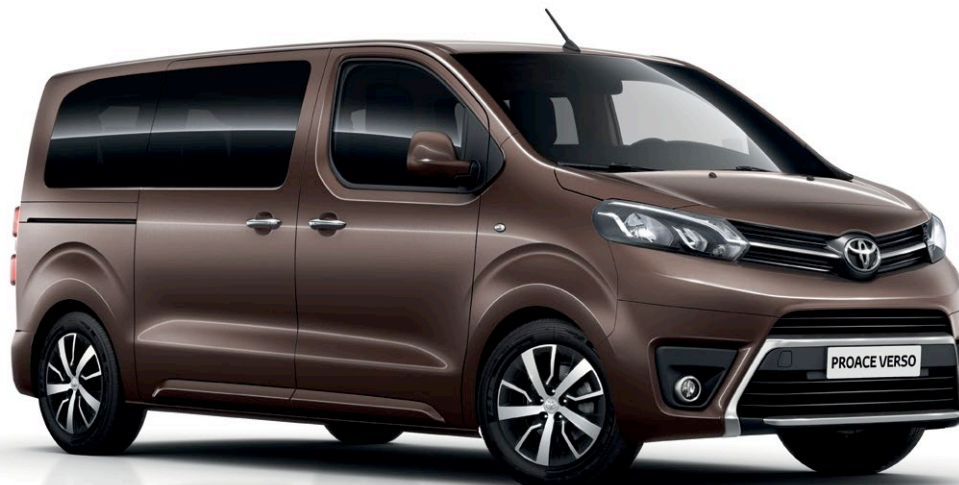
Proace Verso Executive Medium