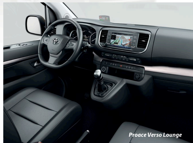
Proace Verso Lounge