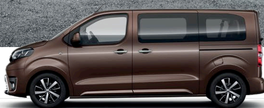
PROACE VERSO MEDIUM