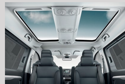
Toit vitré en 2 parties.