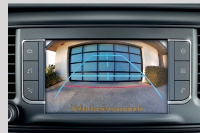
Caméra de recul.