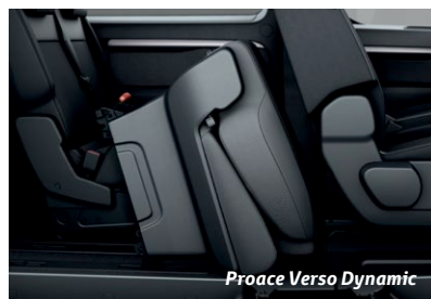
Proace Verso Dynamic

Sièges arrière 2/3 - 1/3 sur rails et amovibles avec dossiers rabattables et indépendants.