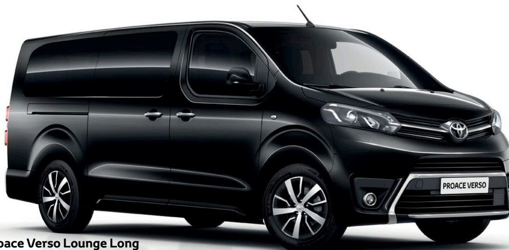
Proace Verso Lounge Long