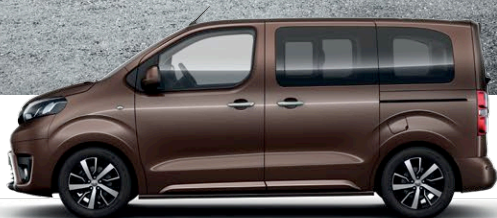
PROACE VERSO COMPACT