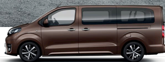
PROACE VERSO LONG