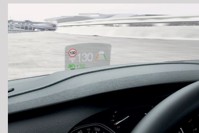
Affichage tête haute couleur.