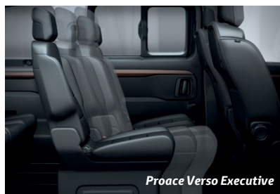
Proace Verso Executive

Table sur rails : Table montée sur rails avec 2 sièges indépendants sur rails, amovibles et pivotants en 2 e rangée, et banquette 2/3 - 1/3 en 3 e rangée.