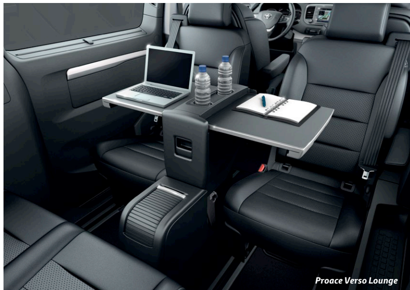
Proace Verso Lounge

Table sur rails : Table montée sur rails avec 2 sièges indépendants sur rails, amovibles et pivotants en 2 e rangée, et banquette 2/3 - 1/3 en 3 e rangée.