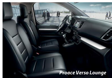
Proace Verso Lounge

Sellerie cuir avec sièges avant chauffants et massants.