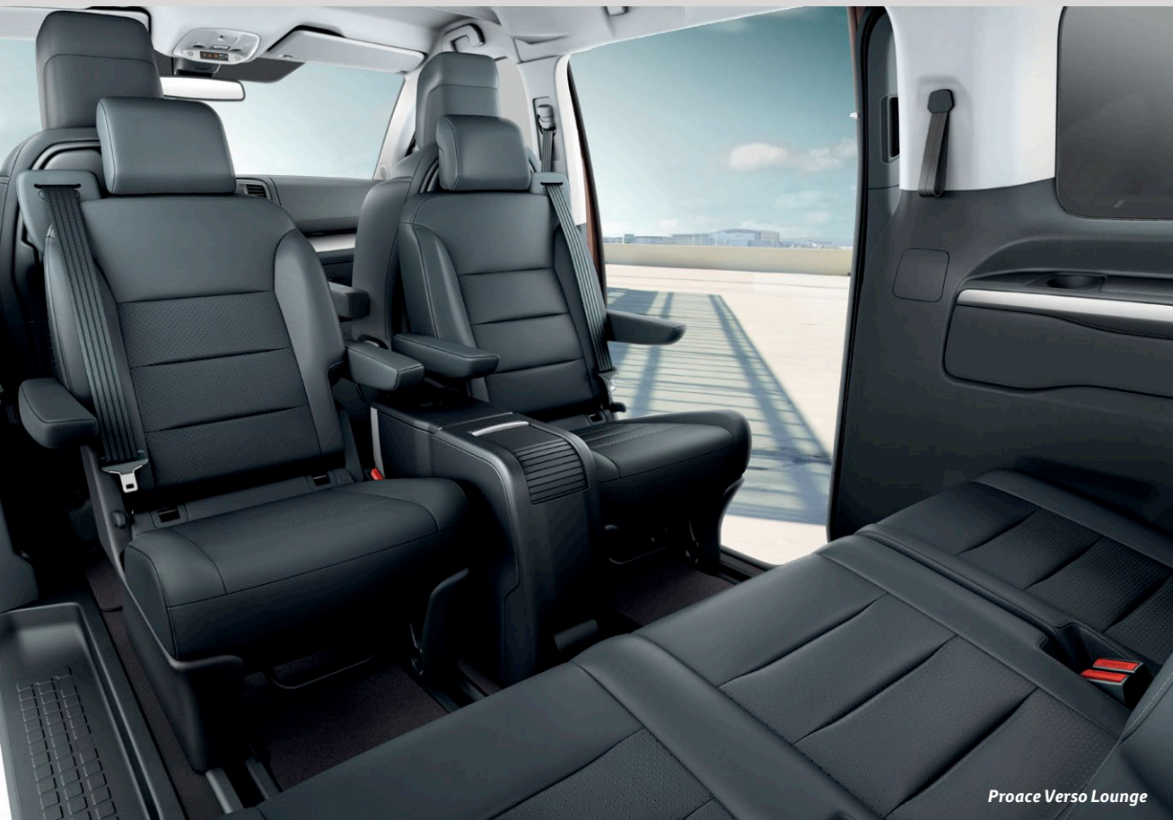
Proace Verso Lounge