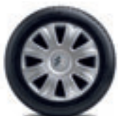
Copricerchi Inca 15"