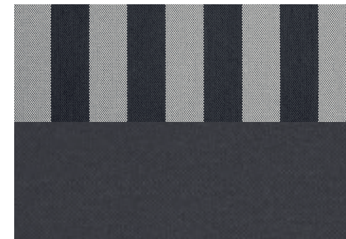
Tessuto Rayure Nero e Bianco