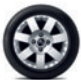
Cerchi in lega Coyote 15"