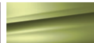
Verde Lacerta (M) **